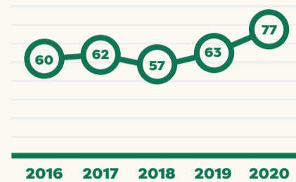
Aantal vrouwen die nadenken over het afstaan van hun kind

In de periode 2016 – 2020 zijn er 319 zwangere vrouwen die nadenken over het afstaan van hun kind .