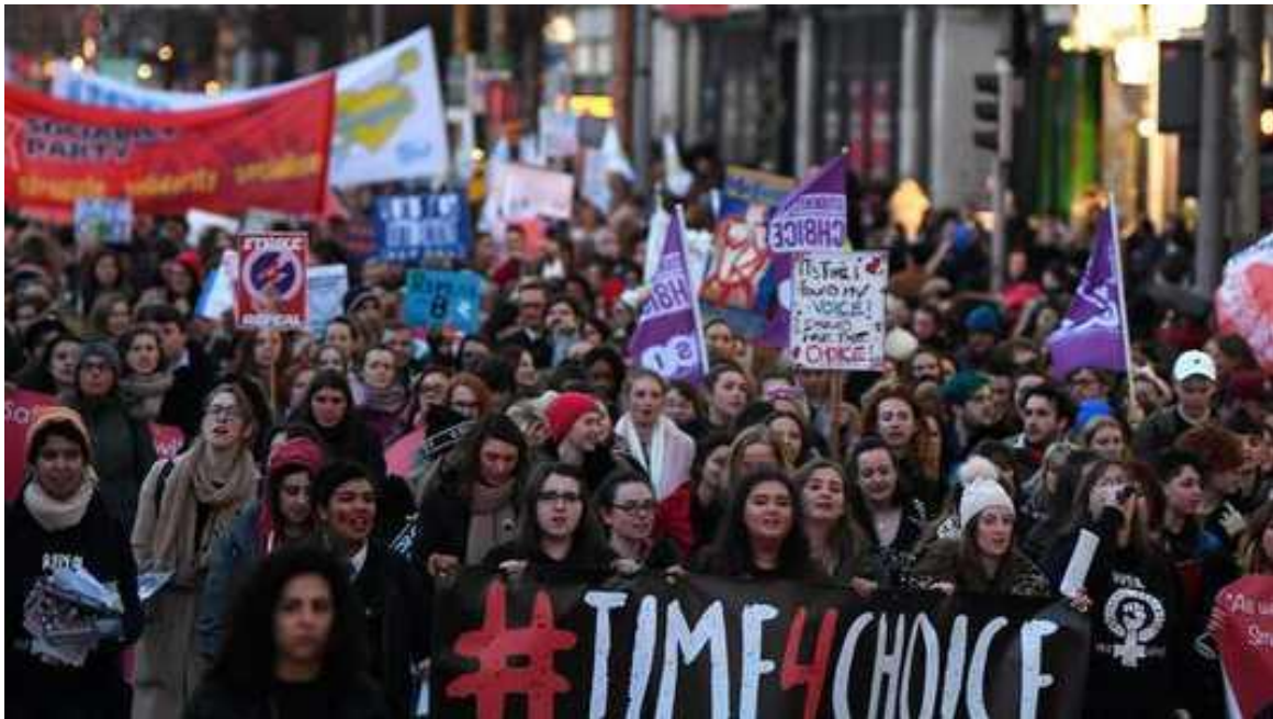
Abortusprotest in Ierland, mei 2018

Ook in België gingen vrouwen de straat op. De regering sprak daar over het schrappen van abortus uit het Wetboek van Strafrecht en behaalde hiervoor een meerderheid. Daarnaast wordt de wet op een paar punten worden aangepast. De vrouw hoeft zich niet langer 'in een noodsituatie' te bevinden om de zwangerschap af te breken. Een term die ook in Nederland in de Wet Afbreking Zwangerschap is opgenomen 12 . Daarnaast worden in België artsen die weigeren een abortus uit te voeren verplicht om door te verwijzen naar collega's en komen er straffen voor iemand die probeert de legale abortus van een vrouw te verhinderen.